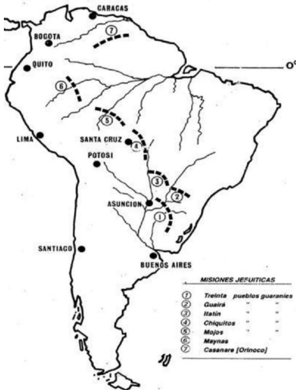
Figura 2: Misiones jesuitas en América del Sur

En la Figura 2 se puede mirar el mapa de las misiones jesuitas en América del Sur.