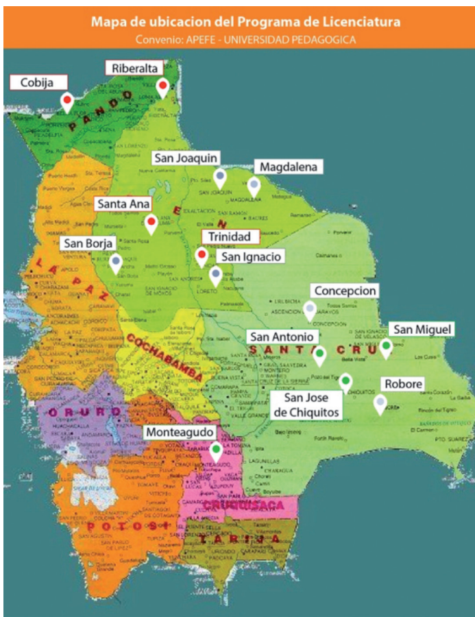
Figura 3: Lugares del Programa licenciatura

habian obtenido aun la Licenciatura; las posibilidades de que esto ocurra eran una tarea imposible, ya que las universidades, como dijimos, estan en la ciudad capital, Santa Cruz de la Sierra. En esta dinàmica, luego de la firma de convênios de cooperacion específicos entre el gobiernos de Bélgica y Bolivia, la APEFE en alianza con la Universidad Pedagógica de Sucre organiza el Programa de Licenciatura para maestros bajo la supervicion del Ministerio de Educación como esta demostrado en la Figura 3.