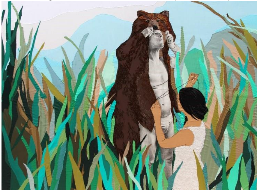
Imagem 6 - Ana Teresa Barboza. (sem título), 2011, da série Animales familiares . Bordado em tecido, (190 x 140 cm)