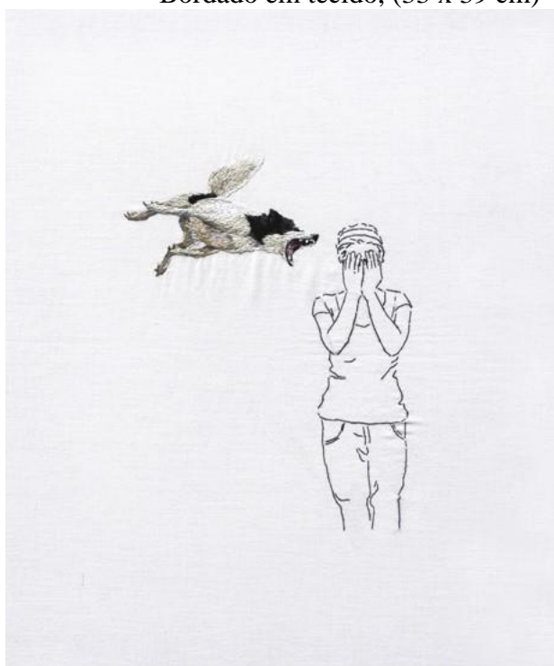
Imagem 7 - Ana Teresa Barboza. (sem título), 2011, da série Animales familiares . Bordado em tecido, (33 x 39 cm)