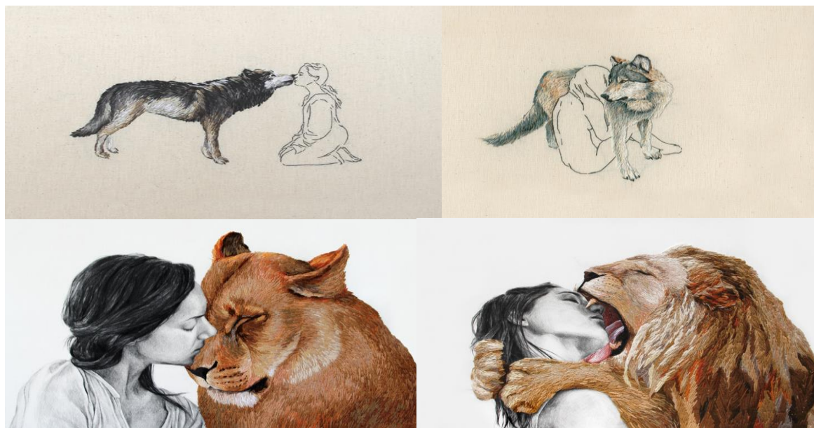
Imagem 5 - Ana Teresa Barboza. (sem título), 2011, da série Animales familiares . Grafite e bordado em tela, (70 x 49 cm).