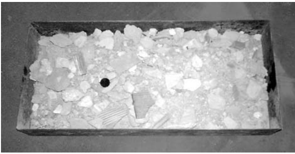
Figura 1: Resíduos antes do beneficiamento