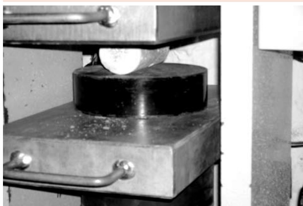
Figura 3: Corpo de prova na prensa

A solicitação à tração tem uma ordem de grandeza maior nas argamassas de revestimento que as de compressão axial. A resistência à tração por compressão está descrita na NBR 7222/1983. Na figura 3, mostra-se um corpo de prova a ser rompido na prensa.