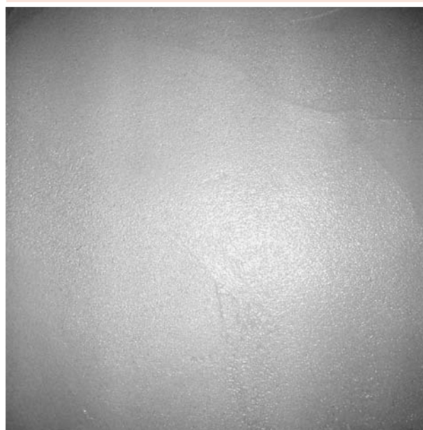
Figura 4: Parede com reboco

determinação desse tipo de resistência foi realizado nos revestimentos com 14 dias, seguindo os procedimentos descritos na norma 13528/1995. Nas figuras 4, 5 e 6, verificam-se os passos do ensaio de arracamento.