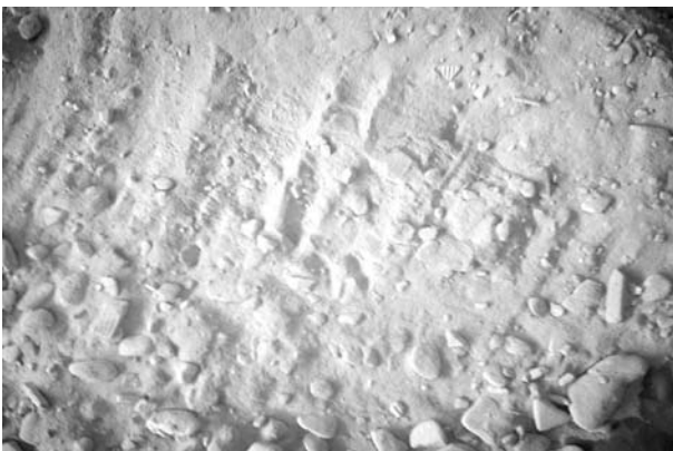
Figura 2: Resíduos beneficiados em um moinho