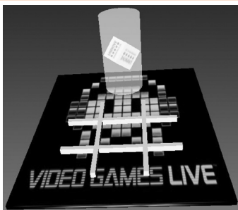
Figura 2: Tela do ARGame

Para interação com o computador, cada jogador tem um marcador representado pela imagem de um círculo (“O”) ou de um xis (“X”), conforme mostrado na Figura 3, os quais, a partir das jogadas dos usuários, são exibidos sobre um tabuleiro (3x3) que também é representado por um marcador específico.