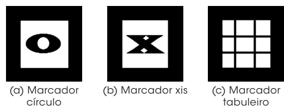
Figura 3: Marcadores utilizados no ARGame

Mais especificamente, foi desenvolvido um jogo, denominado ARGame, que é uma versão eletrônica em 3D do antigo e popular “Jogo da Velha”.