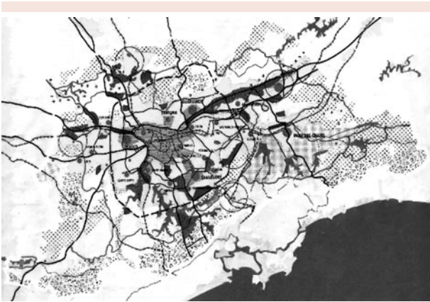
Ilustração 2: Estrutura metropolitana 2010 com indicação dos polos e centros terciários

do modelo de urbanismo pós-moderno promove as participações pública, privada e social, além de novas formas de governabilidade local. São iniciativas locais de caráter isolado no contexto regional, que possuem o lastro dos novos instrumentos de política urbana e da gestão municipal, sem correspondência no âmbito regional, independentemente dos conjuntos de municípios em área metropolitana (Ilustrações 2 e 3).