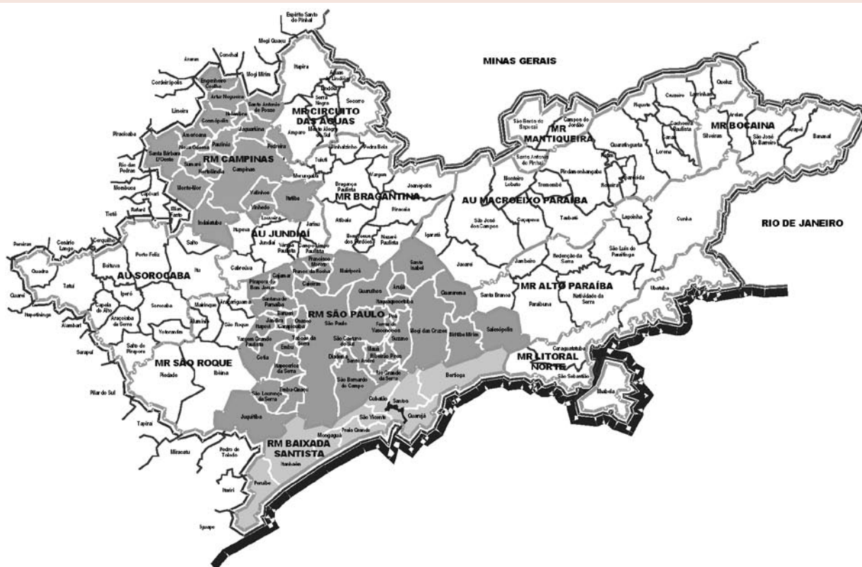
Ilustração 1: Complexo metropolitano expandido (CME): região metropolitana de São Paulo, região metropolitana de Campinas, região metropolitana da Baixada Santista, microrregiões e aglomerações urbanas vinculadas

Planos estratégicos de desenvolvimento vêm sendo formulados visando intervenções urbanísticas com a injeção de capital privado em programas de requalificação de áreas centrais. A aplicação