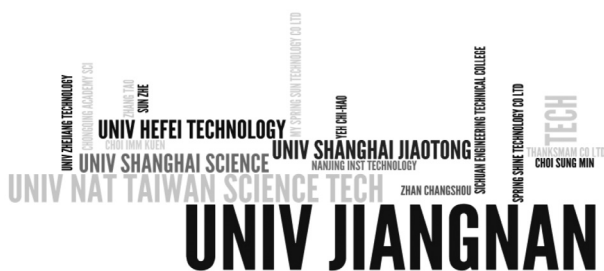
Figura 7: Nuvem com os applicants em relação ao número de patentes

A Figura 7 mostra os principais requerentes de registros ( applicants ), sendo visível o protagonismo das universidades chinesas. Do universo de applicants pesquisados, todos que possuem mais de uma patente solicitada são instituições acadêmicas, como, por exemplo, a Universidade de Jiangnan (< http://english.jiangnan.edu.cn >), na China, que possui 7 dos 27 pedidos depositados.