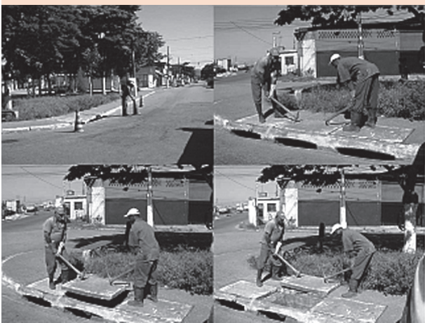
Fotografia 2: Método manual de trabalho da equipe de limpeza