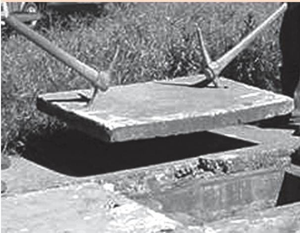
Fotografia 1: Tampa de concreto