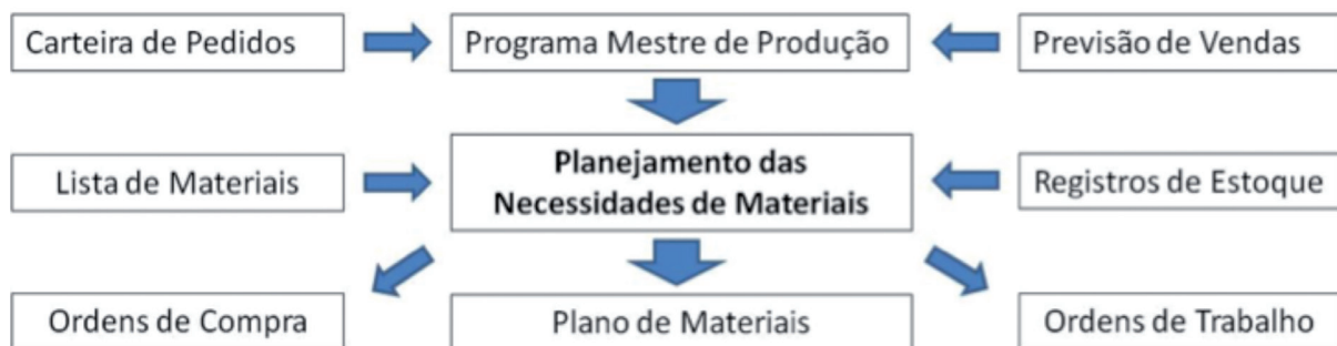
Figura 1: Informações para processo do MRP e Resultados

Segundo Bozic, Stankovic e Rogic (2014) pesquisas atuais têm-se dedicado à melhoria quantitativa, redesenho e otimização de processos de negócios principalmente do ponto de vista de SI. No entanto, estudos sobre questões logísticas deste tópico devem estar mais orientadas para a visão de processo da demanda na cadeia. Presume-se que as ações básicas relativas à otimização dos processos referem-se à integração, à coordenação e ao bom fluxo de informação a fim de gerenciar processos em tempo real, e que permitam relatórios sobre atividades operacionais. Gerenciar os processos em tempo real promove o estabelecimento de uma avaliação direta do desempenho do processo permitindo uma identificação precisa e a análise de desvios na logística.