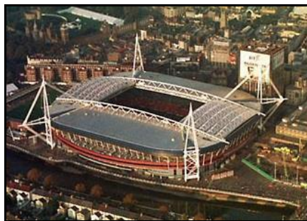
Fig. 08: Millennium Stadium

O Millennium Stadium, com capacidade para 74.500 pessoas e com custo estimado em 200 milhões de dólares, é de autoria do Populous e teve suas obras finalizadas em 1999. É a casa das seleções galesas de rúgbi e de futebol e apresenta utilização mista. Foi utilizado na Copa do Mundo de Rúgbi de 1999, de 2007 e de 2015, assim como recebeu partidas de futebol nos Jogos Olímpicos de Londres, em 2012 (Millennium Stadium, 2009).