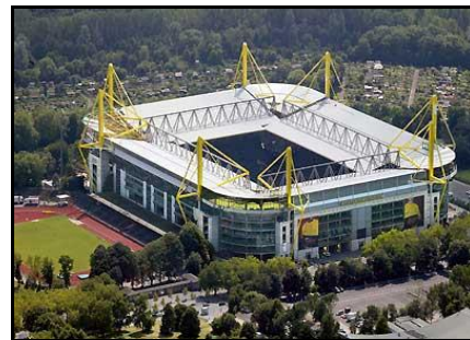
Fig. 09: Signal Iduna Park

O Signal Iduna Park, para 65.718 pessoas, em partidas internacionais, e com obras estimadas em 264 milhões de dólares é de autoria dos arquitetos: Planungsgruppe Drahtler, Ulrich Drahtler e Schulte-Ladbeck. Foi construído, originalmente, em 1971 e sua última reforma ocorreu em 2005. Seus mandantes são as equipes de futebol Ballspiel-Verein Borussia 1909 e V. Dortmund e apresenta usos variados. Foi utilizado nas Copas do Mundo FIFA™ Alemanha 1974 e 2006, na Liga dos Campeões da UEFA