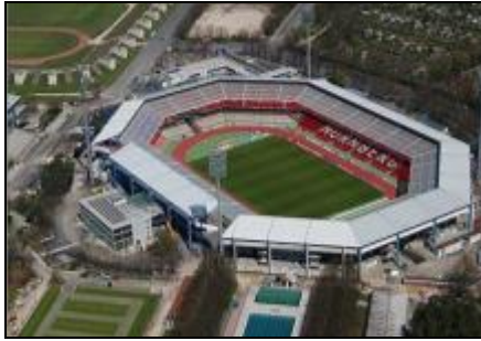
Fig. 06: Frankenstadion