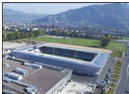
Fig. 05: Stockhorn Arena

O pequeno estádio poliesportivo francês Stadium du Littoral, com apenas 617 assentos e ao custo de 5,2 milhões de dólares, foi considerado um dos estádios mais sustentáveis. Seu projeto, idealizado pelo OLGGA Architects, foi inaugurado em 04 de setembro de 2011. Seu mandante é o Olympique Grande-Synthe Football (Arch Daily, 2011).