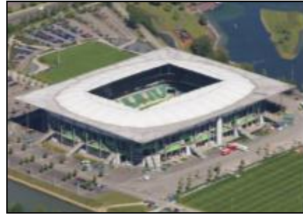
Fig. 07: Volkswagen Arena

Já o Volkswagen Arena, para 30.000 pessoas, ficou orçado em 70 milhões de dólares. O projeto, desenvolvido por um grupo de escritórios de arquitetura, teve suas obras finalizadas em dezembro de 2002. O VFL Wolfsburg é sua equipe mandante e dá nome a uma das nomenclaturas da arena multiuso: o VFL Stadion. Foi utilizado na Copa do Mundo FIFA™ Alemanha de futebol feminino e é usado comumente pela Bundesliga (OC, 2011).