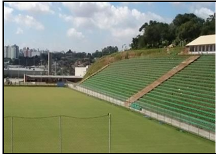
Fig. 03: Eco Estádio Janguito Malucelli

recebe partidas dos Campeonatos Brasileiro e Paranaense de Futebol (JMalucelli, 2012).