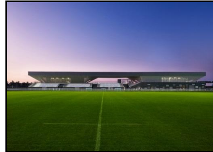
Fig. 04: Stadium du Littoral