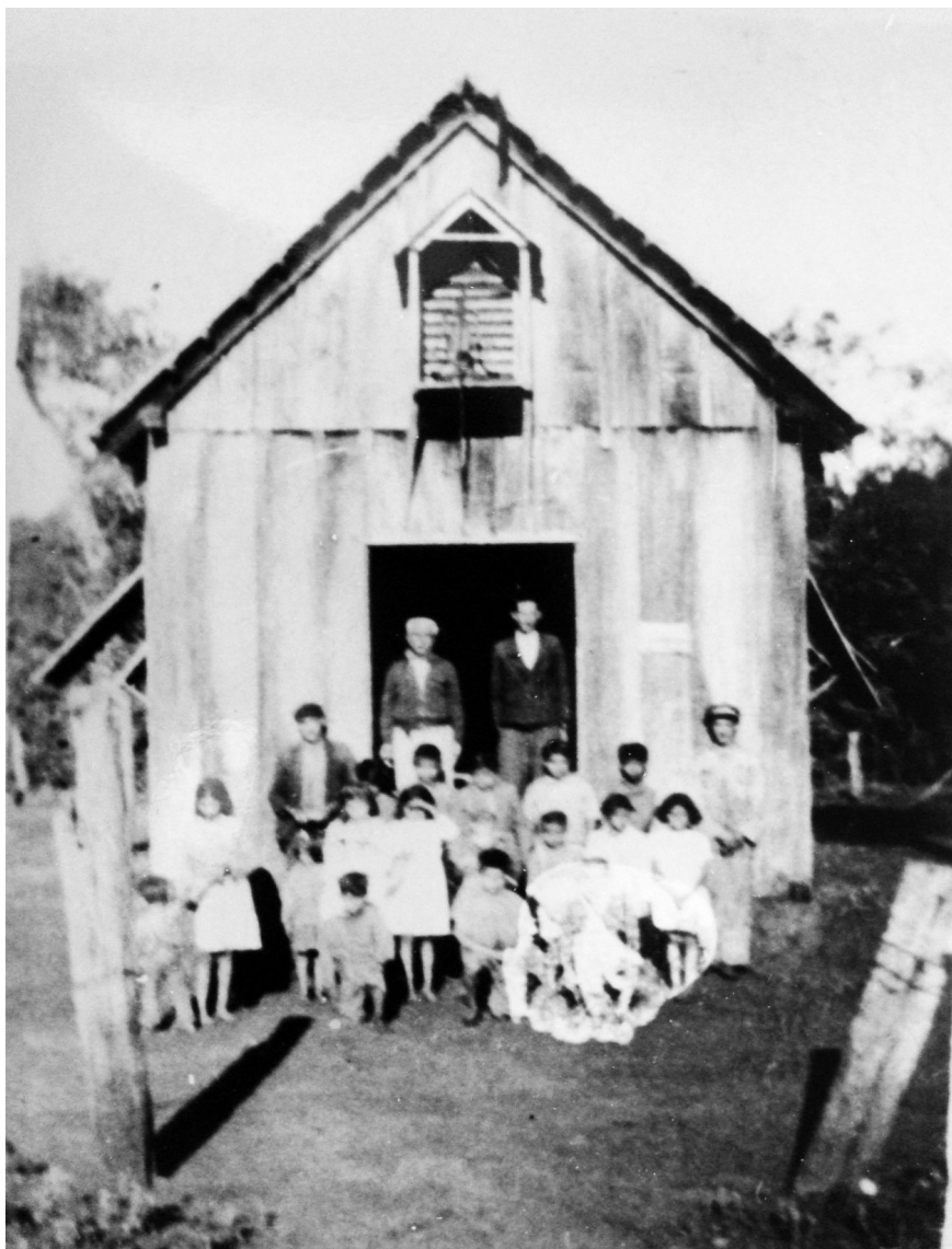
Figura 2: Alunos da Escola de Porto Britânia (década de 1930)