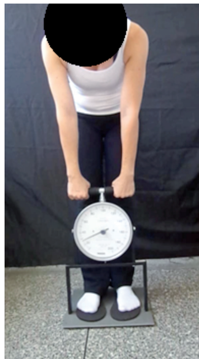
Figura 1: Dinamômetro lombar

Teste Biering-sorensen analisa a resistência dos músculos extensores de tronco 18 . O voluntário foi posicionado em decúbito ventral com os membros inferiores apoiados em um suporte de madeira e o