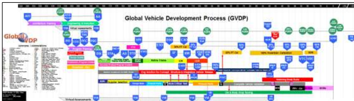
Figura 2 – Fases do Desenvolvimento de Produto da Empresa

Por fim, a Execução do Programa é a cronometragem do ramp-up de recursos funcionais significativos para completar as atividades que antecederam a início da produção regular (SORP).