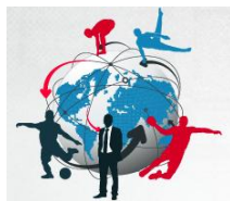
Figura 2 - Modelagem de Trabalho, elaborado pela autora a partir das entrevistas.