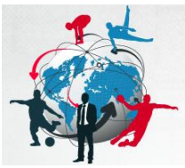
Figura 1 - Modelo de Diagnóstico de Gestão de Pessoas.