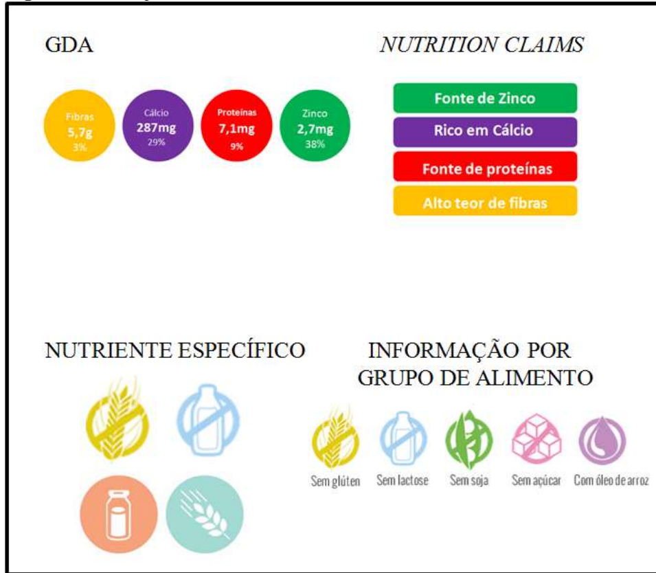
Figure 1 – Examples of Nutrition Information Presentation Models