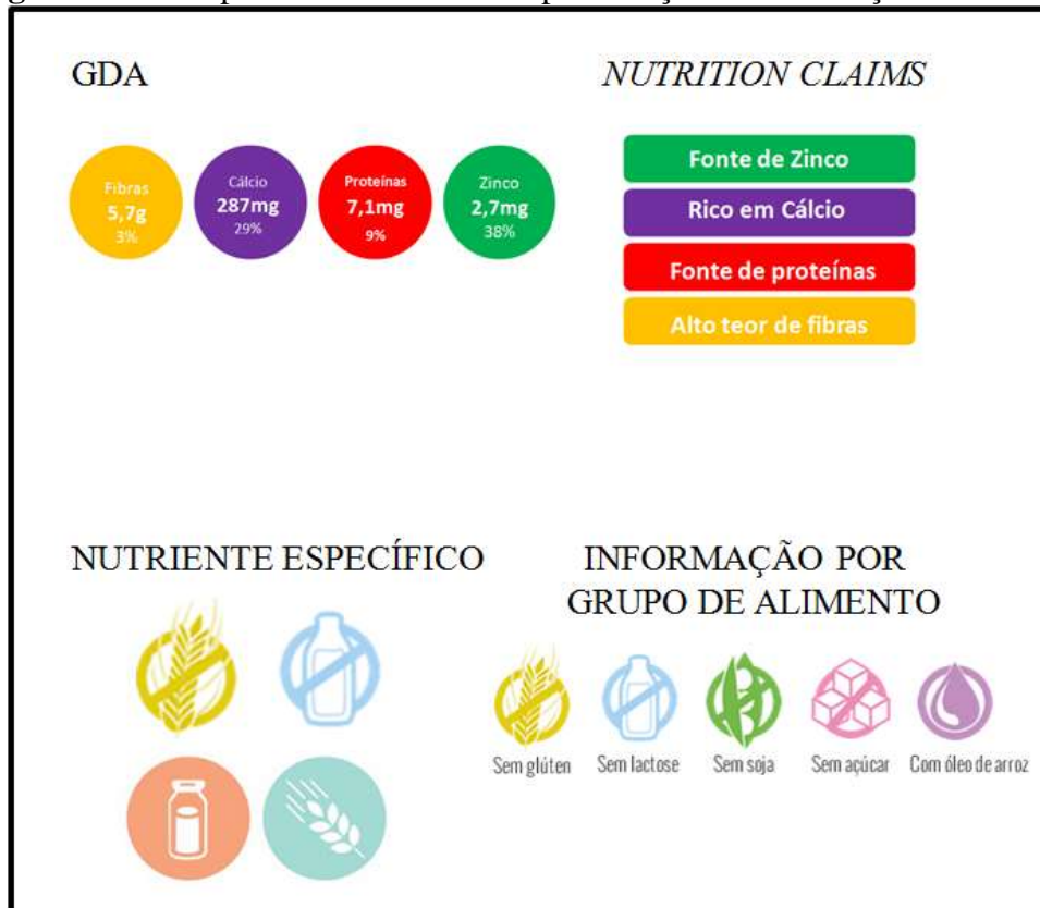
Figura 1 – Exemplos dos Modelos de Apresentação da Informação Nutricional