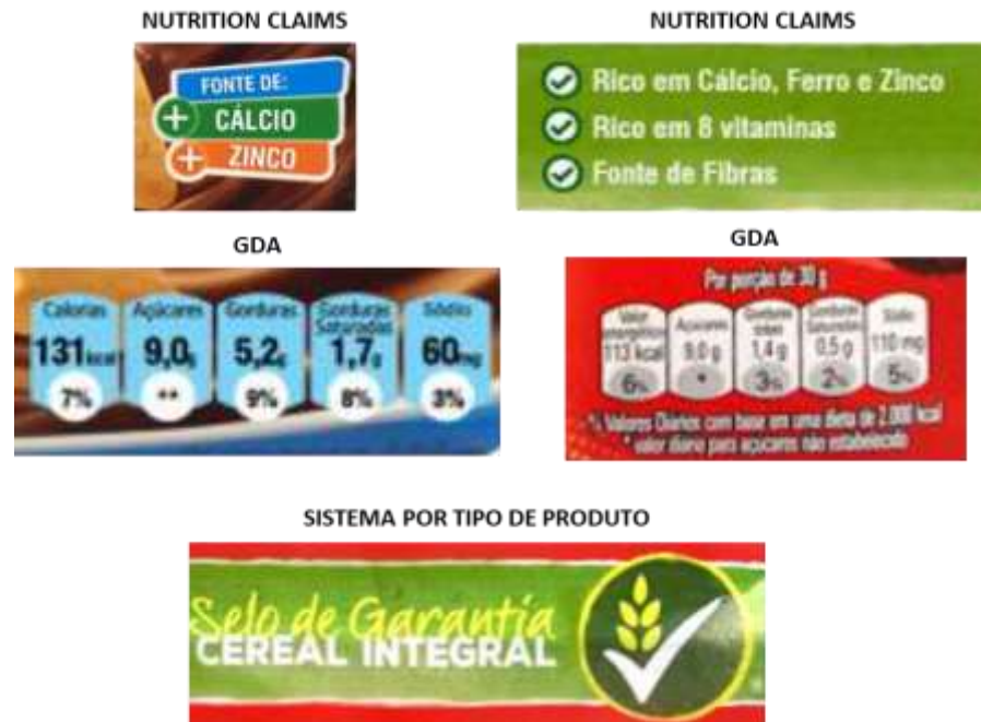
Figura 2 – Modelos utilizados nas embalagens do estudo