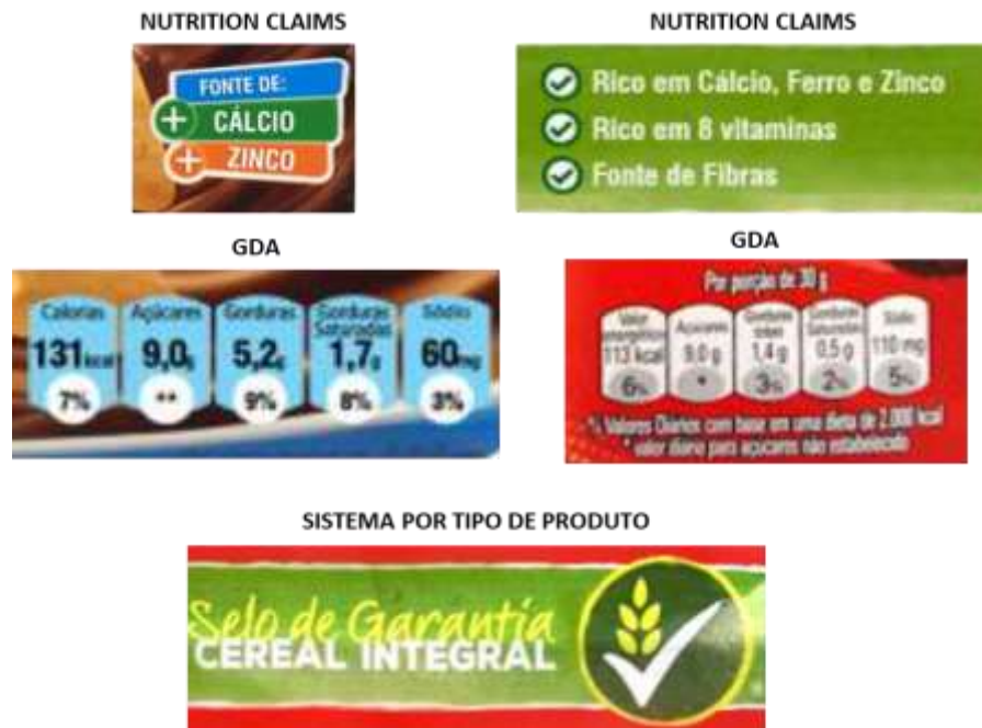
Figure 2 – Models of packaging used in the study