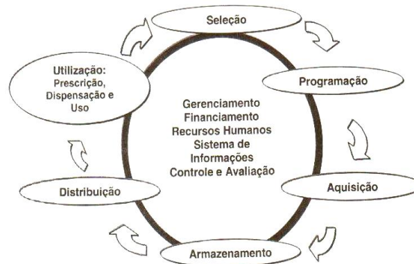
Figura 1. Ciclo da Assistência Farmacêutica

Assistência Farmacêutica (Figura 1). De importância fundamental para o processo de reorganização da Assistência Farmacêutica, as atividades que compõem esse Ciclo promovem, se bem executadas, o acesso da população a medicamentos essenciais, de qualidade e com orientação, racionalizando o uso e promovendo a melhoria na qualidade dos serviços e na qualidade de vida da população atendida (Oliveira, 2004).