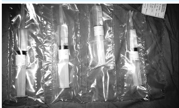
Figura 3: Armazenamento do medicamento após o preparo

Um sistema de distribuição de medicamentos deve ser racional, eficiente, seguro e estar de acordo com o esquema terapêutico prescrito. Quanto mais eficiente for a distribuição, mais garantido será o sucesso da terapêutica e da profilaxia instauradas no hospital 5 .