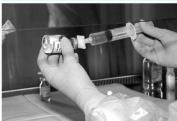
Figura 2: Manipulação e fracionamento do medicamento