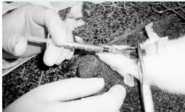
Figura 1: Exposição da traqueia e instilação da solução de papaína entre os anéis traqueais

dias para que fosse gerado o processo inflamatório (Figura 1).