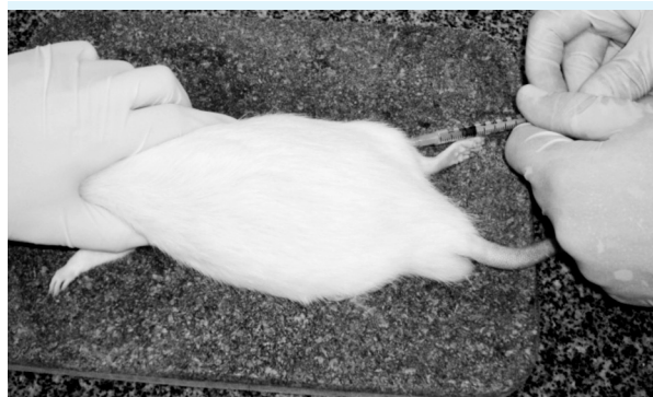
Figura 2: Aplicação do corticoide IM na região posterior da coxa

A dose de dexametasona foi 0,5 mg/kg/dia 15 . Sua aplicação ocorreu de forma intramuscular (IM) na região posterior da coxa (Figura 2) e do LBP, em três pontos na face frontal: um na região da carina e outros dois no centro de cada hemitórax (Figura 3), com densidade de energia de 7 J/cm 2 , cada ponto foi utilizado 14 segundos de aplicação, totalizando um tempo de 42 segundos (determinado pelo aparelho), uma vez ao dia.