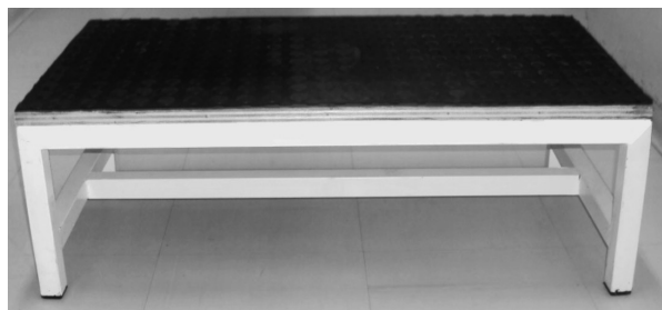
Figura 2: Teste do degrau

finalização foram dadas a cada minuto, como por exemplo, “você está indo bem, faltam dois minutos”, utilizando um tom uniforme de voz. Antes e após a execução do teste foi verificado os sinais vitais (frequência cardíaca, pressão arterial sistólica, pressão arterial diastólica, frequência respiratória, saturação periférica de oxigênio e temperatura axilar) e a percepção da intensidade do esforço ao exercício com a escala de Borg modificada 9 .